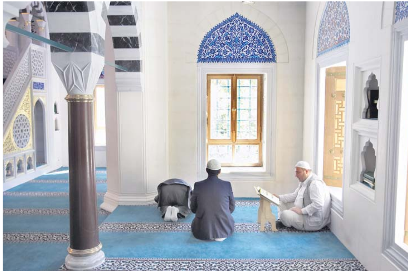
Sehlik-Moschee in Berlin-Neukölln: Finanzdienstleister stellen sich auf das Zinsverbot des Koran ein, um Muslime als Kunden zu gewinnen